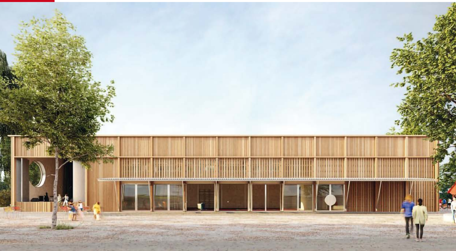
Image de synthèse du projet – sous réserve des ajustements à venir