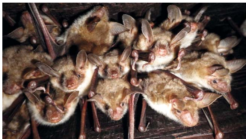
Grand murin