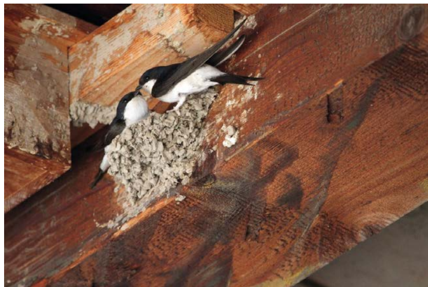
Hirondelles de fenêtre